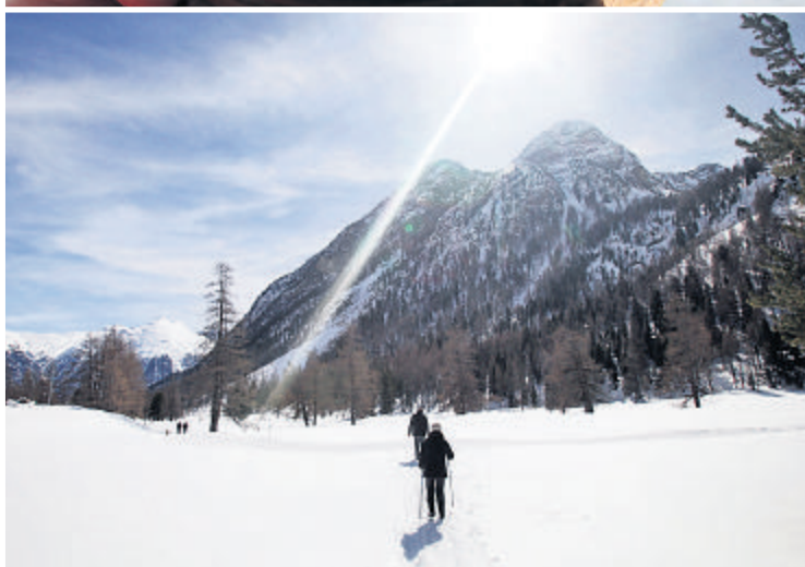
Entschleunigen: Wenn Sie an der Haltestelle Spinas aus der Rhätischen Bahn steigen, kommt die Erholung zum Zug – ob bei Pizzoccheri im Restaurant Spinas von Angela Degiacomi (li.) und Adelheid Grimmer, bei Kutschenfahrten oder beim Skiwandern im einsamen Val Bever