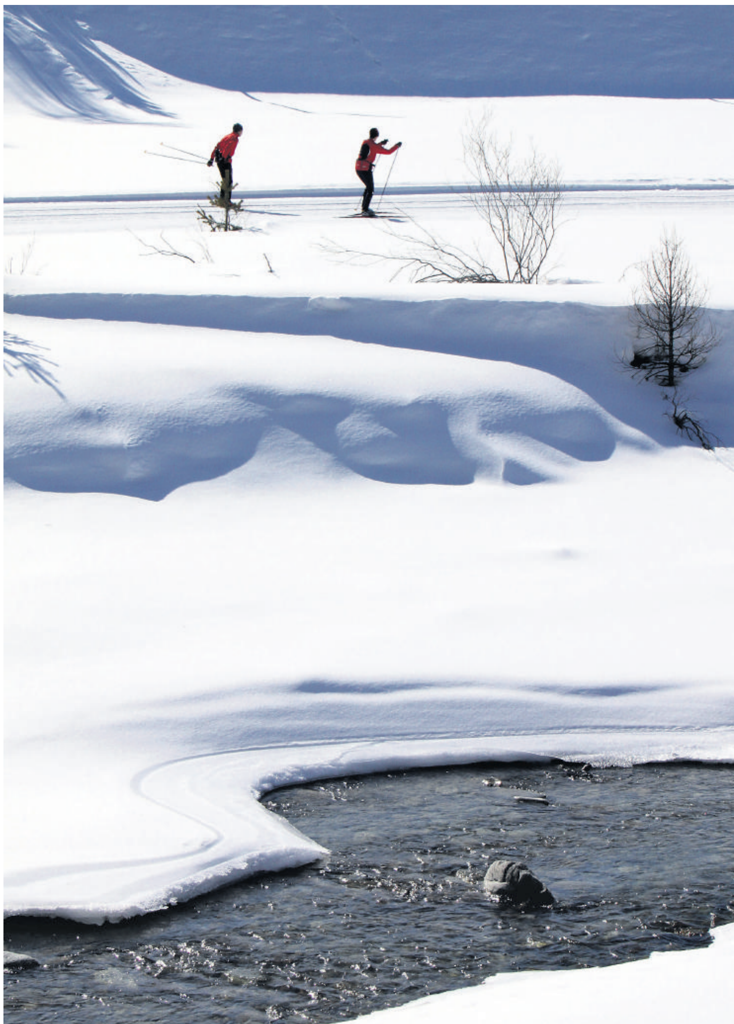
Was das Läuferherz begehrt: Der Einsamkeit entgegengleiten und Anschluss finden an das grosse Loipennetz des Oberengadins